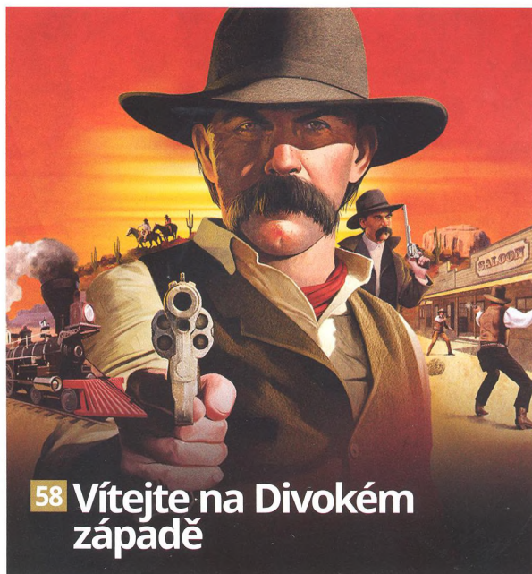
58 Vítejte na Divokém západě