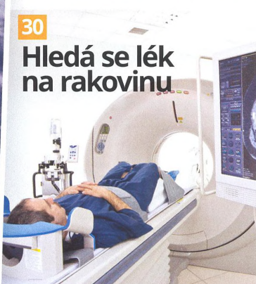
30 Hledá se lék na rakovinu