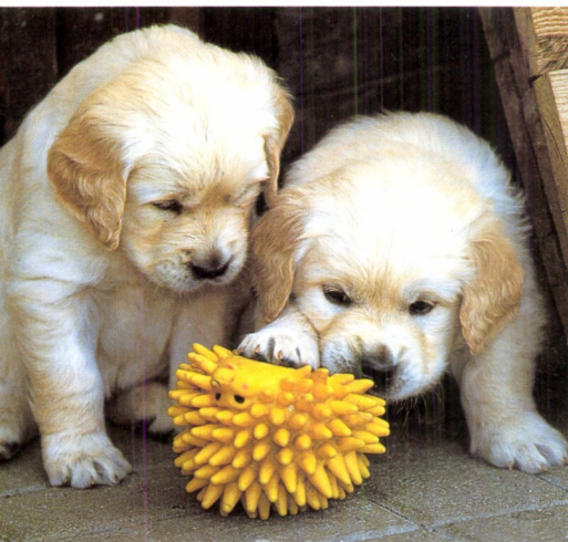
Štěňata zlatého retrívra zvědavě zkoumají své okolí.