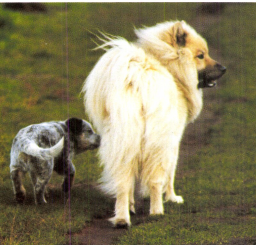
Pro zdravý vývoj štěněte jsou nezbytná setkání s jinými psy.