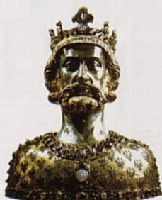
Busta Karla I. Velikého