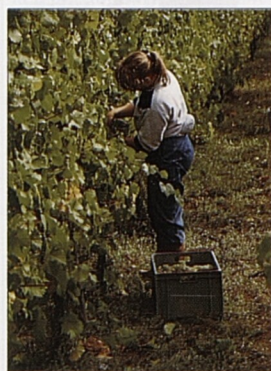
Vinobraní v Alsasku