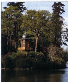
Ostrov v Buloňském lesku