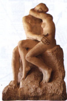
Rodin: Polibek (1886)