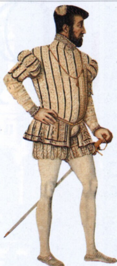
Jindřich II. (1547–59)