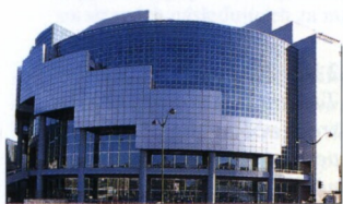
Opéra de Paris Bastille