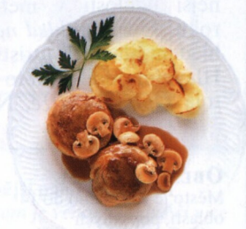
Noisettes - jehněčí kotlety