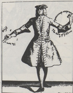
Fig. 50. Preparatory Position for the Execution of the Temps de Courante