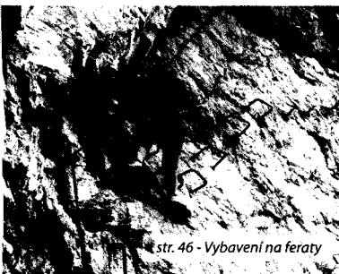
str. 46 - Vybavení na feraty