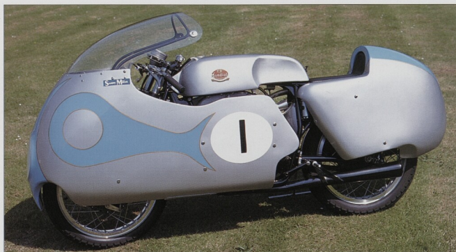
Závodní stroj Grand Prix - Mondial GP z roku 1950. Většina okruhových motocyklů z té doby používala plnou nebo „popelnicovou“ kapotáž z důvodu zlepšení výkonu. Na tomto motocyklu vyhrál šampionát do 250 cm 3 Cecil Sandford.