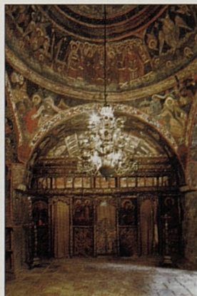
Kostel archandělů Michaela a Gabriela v Arbanasi