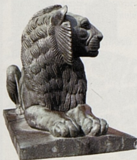
Socha lva na hrobě neznámého vojína v Sofii