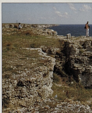
Křídové útesy nedaleko Kamen Brjagu na pobřeží Černého moře

Přední obálka – hlavní obrázek: Bačkovský klášter