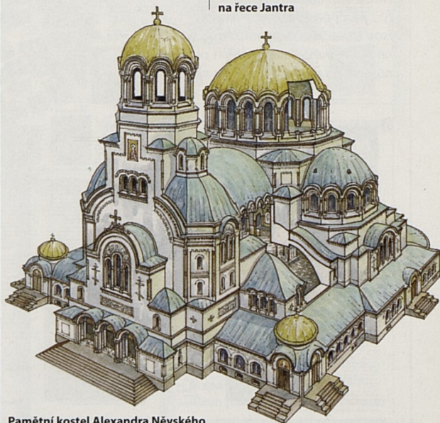
Pamětní kostel Alexandra Něvského v Sofii, jedna z nejhezčích budov města