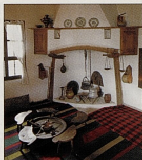
Raikovův dům-muzeum v Trjavně