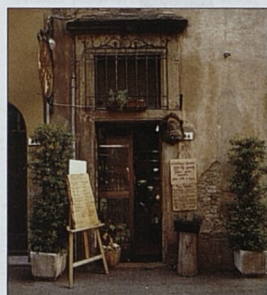
Typický krámek ve Volteře, Toskánsko