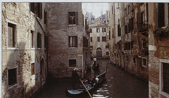
Gondoly prolouvající spleť benátských kanálů