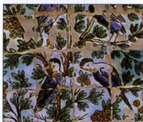
Dlaždičková výzdoba ze 17. století na Paláciu Fronteira, Lisabon