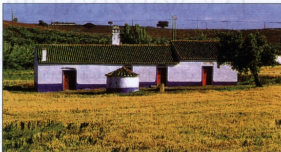
Typický modře lemovaný dům poblíž Beji v Alenteju