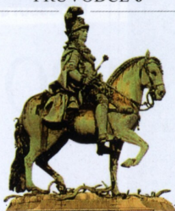
Jezdecká socha Josefa I. na Praça do Comércio, Lisabon