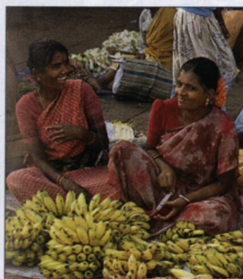
Prodavači zeleniny na chodnících v George Townu, Madrás