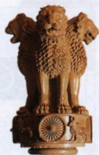
Hlavice Aśokova sloupu, Sárnáth

Hlavní obrázek na přední straně obálky: Humájúnova hrobka v Novém Dillí