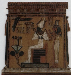
Osiris, Ísis a Nefthys Detail ze str. 17