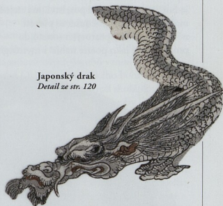
Japonský drak Detail ze str. 120