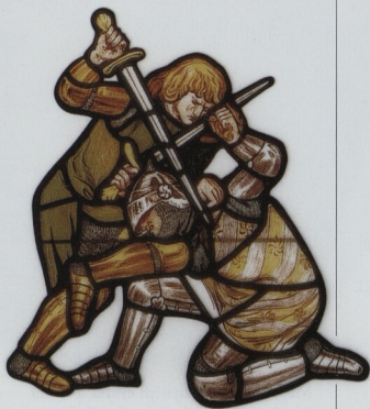
Tristan zabíjí Mordreda Detail ze str. 82