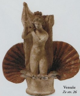
Venuše Ze str. 26