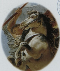
Bellerofontés Detail ze str. 47