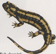
Mlok skvrnitý (Salamandra)