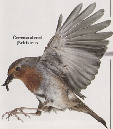
Červenka obecná (Erithacus)