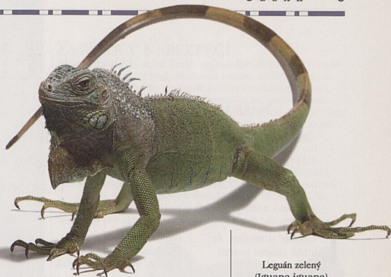
Leguán zelený (Iguana iguana)