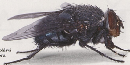
Bzučivka rudohlavá (Calliphora)