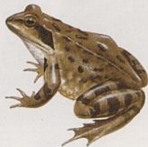
Skokan hnědý (Rana)