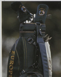
EXKLUZIVNÍ VÝBAVA Golfový bag z Ryder Cupu