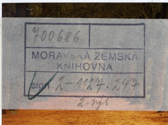
Průhled alejí v Parc du Cinquantenaire