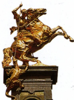
Zlacená socha v průčelí cechovního domu v Antverpách