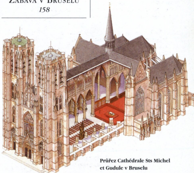
Průřez Cathédrale Sts Michel et Gudule v Bruselu