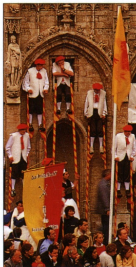
Účastníci festivalu v pestrých kostýmech na Grand Place