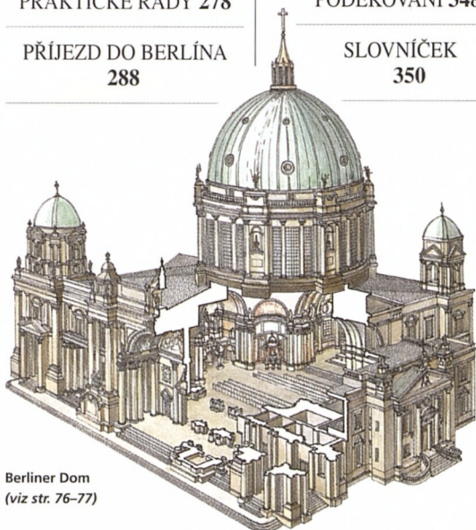
Berliner Dom (viz str. 76–77)