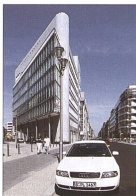
Moderní architektura u bývalého Checkpoint Charlie (viz str. 141)