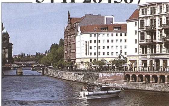
Reka Spréva protékající čtvrti Nikolaiviertel (viz str. 88–89)