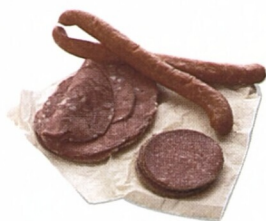
Ukázka německých uzenin (viz str. 232–33)