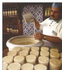
Prodáváč nabízející bezus, nápoj ze slabě prokvašeného obilí