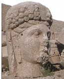
Kommuğenská kamenná hlava na boře Nemrut (Nemrut Dağı)