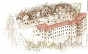
Kláster Sumela (viz str. 272)