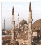
Symboly Istanbulu – Hagia Sofia a Modří mešita