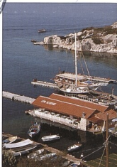
Vesnice Čağalı na pobřeží Středozemního moře