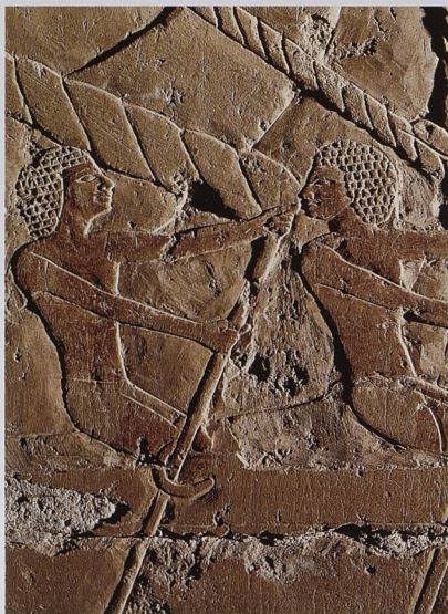
Výprava do Puntu