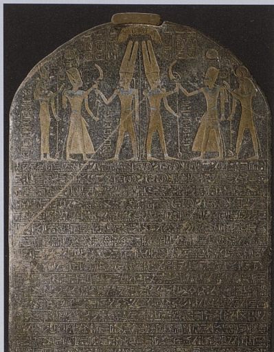
„Izraelská stéla“ panovníka Merenptaha