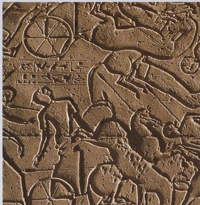
Bitva u Kadeše