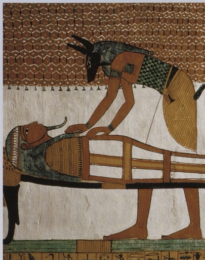
Anup připravující mumii umělce Sennedžema