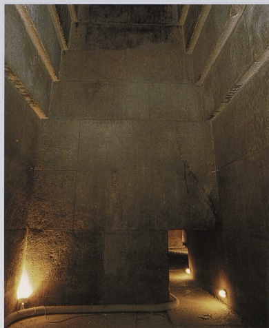
Vnitřní prostory Červené pyramidy panovníka Snofrua