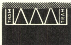
11b Zastávka tramvají

Vyznačují zastávku autobusů, trolejbusů nebo tramvají. K vyznačení prostorů, které je třeba zajistit pro vozidla zásobování je možno užít vodorovné dopravní značky č. 11 s nápisem „ZÁSOB“.