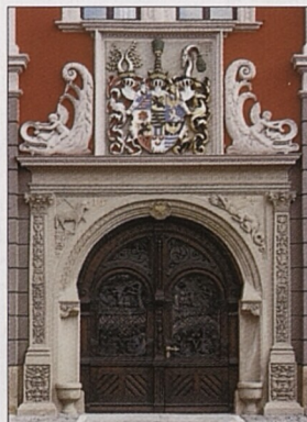
Renesanční portál radnice v Gotze