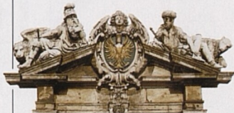
Heraldický štít nad vchodem do norimberské radnice