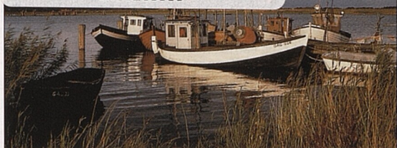
Malebná jezerní krajina v Meklenbursku