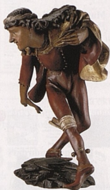
Socha tanečnicka v Městském muzeu v Mnichově (viz str. 204)