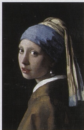
Johannes Vermeer: Dívka v turbanu (1665)