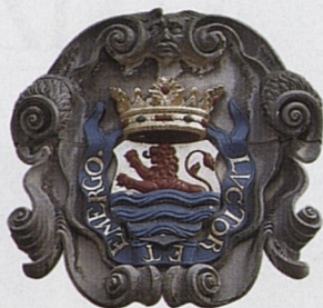
Erb provincie Zeeland