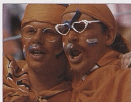
Fanušci na Thialfstadionu (viz str. 298)