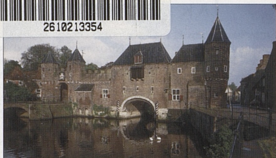
Koppelpoort z 15. století u Amersfoortu