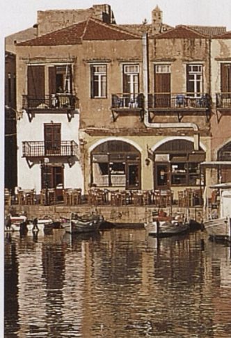
Přístav v krétském Réthymnu