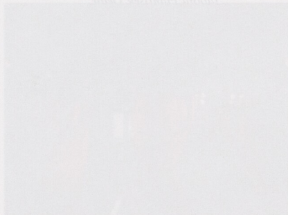
Z mnoha detailů celých nebo rekonstruovaných tvarů keramiky, stříbra a zlatěné keramiky z konce 16. století, pocházející z domu čp. 308, byla v expozici vystavěna jen reprezentativní část.