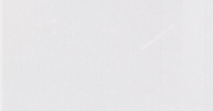
Prostřední část nové stálé expozice představuje poslední umělecký blok, věnovaný tématu 16. století, kdy dům čp. 308 získal táborský městský právo.