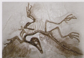
Fossilizovaná kostra archeopteryxe, dávného praptáka