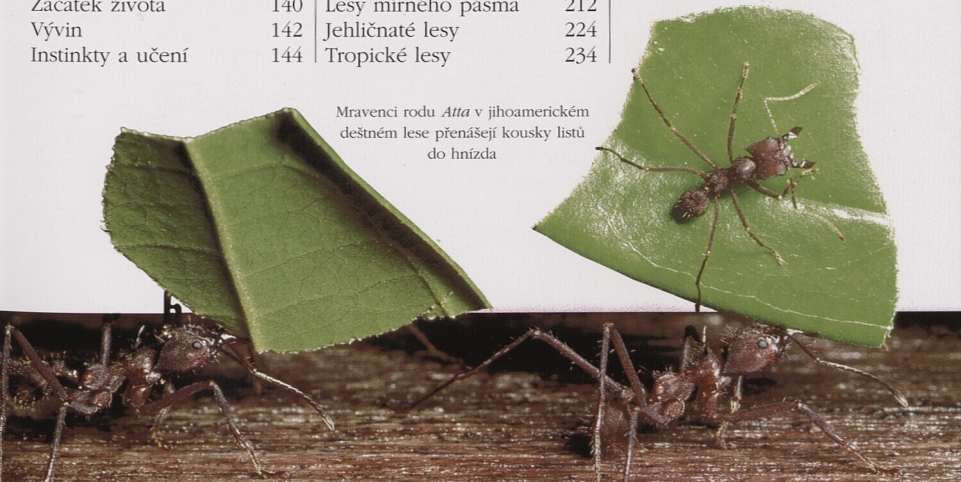
Mravenci rodu Atta v jihoamerickém deštném lese přenášejí kousky listů do hnízda