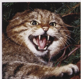
Kočka divoká hrozí nepříteli syčením a typickým výrazem s obnaženými zuby