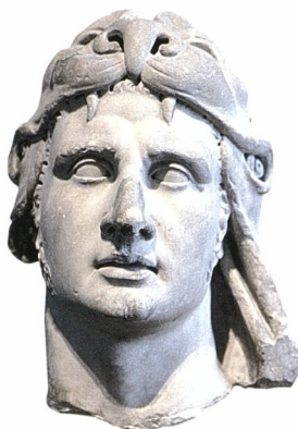
Busta Alexandra Velikého

32 - 37 ATHÉNSKÝ STÁT kol. 500 - 400 př. n. l.