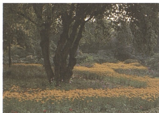
Zahrada se žlutými plochami rudbekií (třapatek)