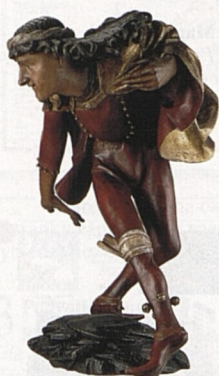
Socha tanečnicka v Městském muzeu v Mnichově (viz str. 204)