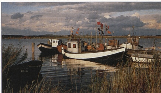
Malebná jezerní krajina v Meklenbursku