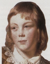
Detail Thomase Listera viz str. 56