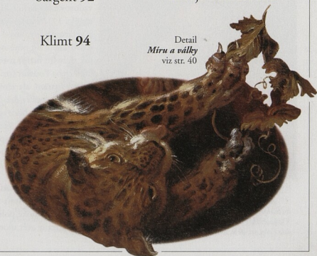
Detail Míru a války viz str. 40