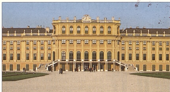
Průčelí zámku Schönbrunn (viz str. 170-173)