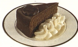
Sachertorte (str. 207)