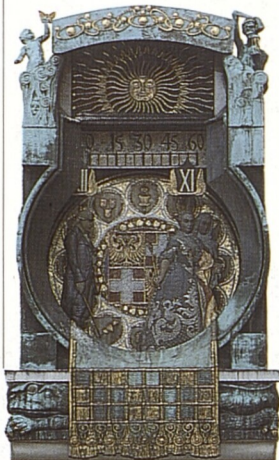
Hodiny Ankeruhr z bronzu a mědi v Hoher Marktu (str. 84)