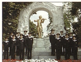
Vídeňský chlapecký sbor (str. 39)