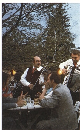
Restaurace v Grinzingu (str. 215-17)