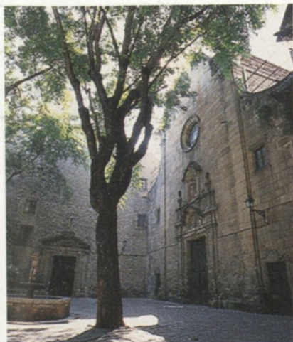
Plaça de Sant Felip Nerri, Barri Gòtic