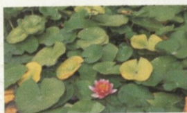
Jardins Mossèn Jacint Verdaguer