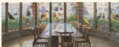
Interiér Casa Lleó Morera