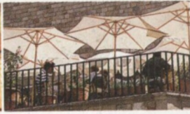
Terasa kavárny v Barri Gòtic