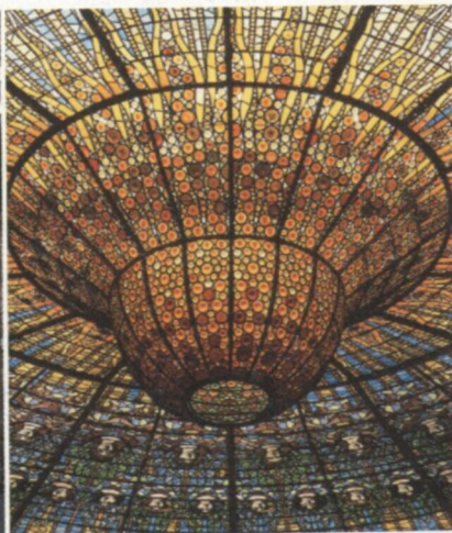
Strop z barevného skla, Palau de la Música Catalana