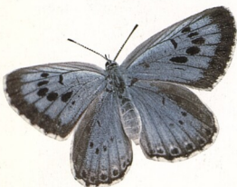
Na obálce: Včela opylující květ šalvěje.

Všechna práva vyhrazena. Žádná část této knihy nesmí být reprodukována, skladována ve vyhledávacím systému nebo předávána v žádné formě nebo žádným prostředkem, elektronickým, mechanickým, fotokopírováním, nahráváním nebo jinak, bez předchozího svolení vydavatele.