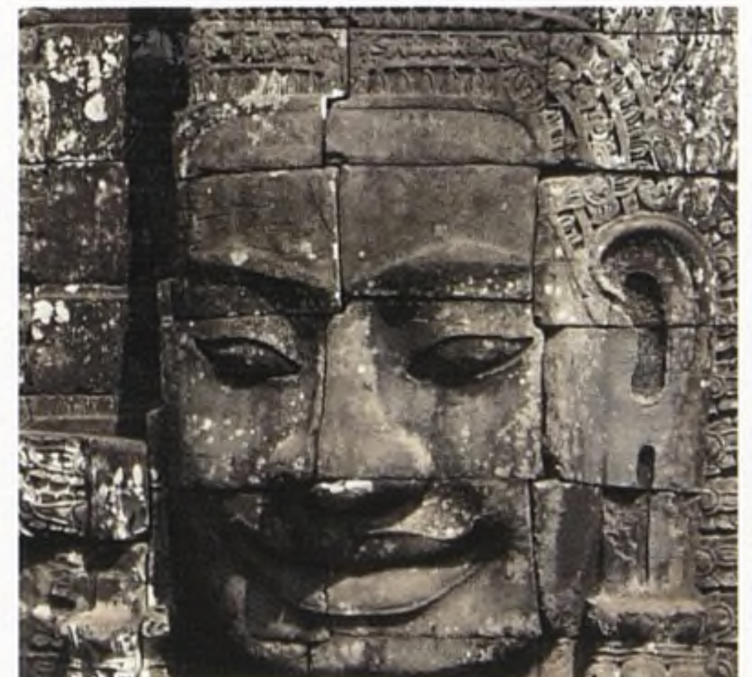
Chrámový reliéf, Angkor, Kambodža