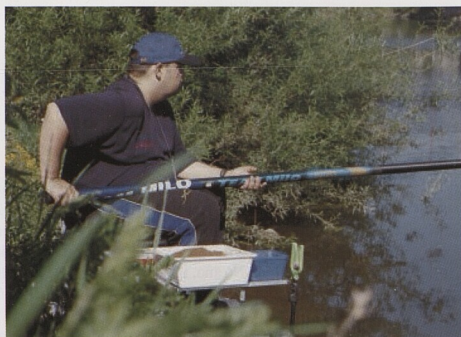
S děličkou lovíme naprosto přesně: precizní rybolov od strany 6.