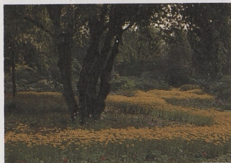
Zahrada se žlutými plochami rudebekií (třapatěk)