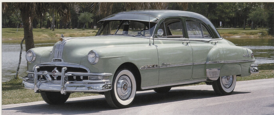
Pontiac Chieftain byl jedním z nejstylovějších a nejdramatičtějších vozů počátku 50. let. Toto je model Chieftain De Luxe z roku 1951.