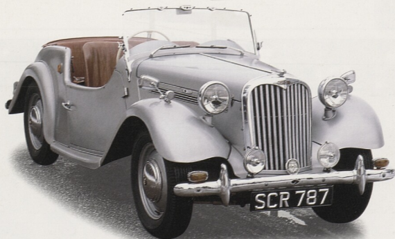
Singer SM Roadster, známý také jako 1500 Roadster, byl uveden na trh roku 1951 a měl konkurovat MG TD. Byl trochu víc než vylepšený Nine Roadster z roku 1939 a nabízel jen fádňi výkonnost.