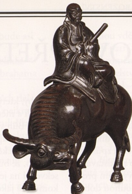
LAO-C', K ASIJSKÝM NÁBOŽENSTVÍM, STR. 152