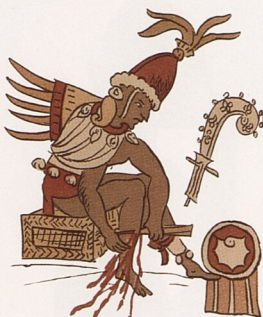
AZTÉKOVÉ NA POČÁTKU, STR. 48