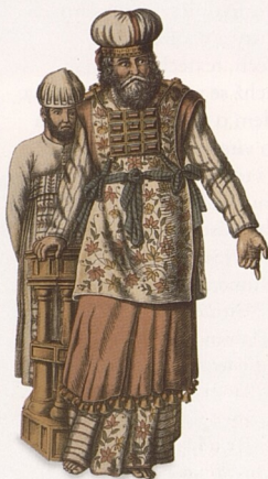
KNĚŽÍ, K ABRAHAMOVSKÝM NÁBOŽENSTVÍM, STR. 198