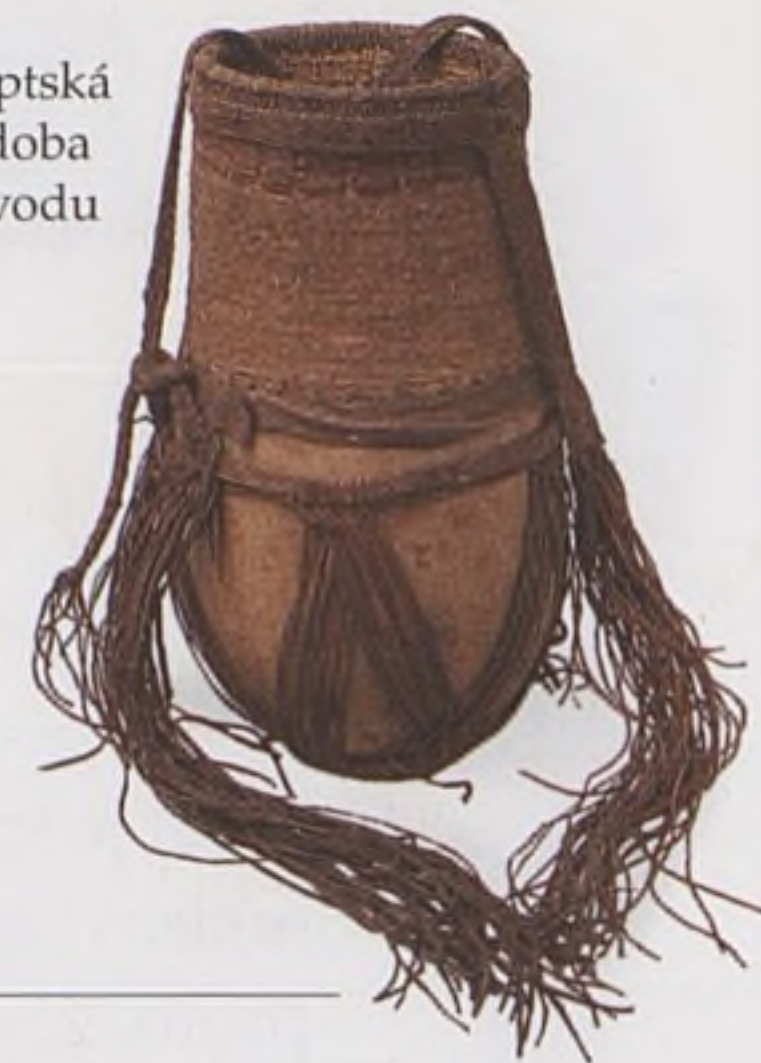
Egyptská nádob na vodu