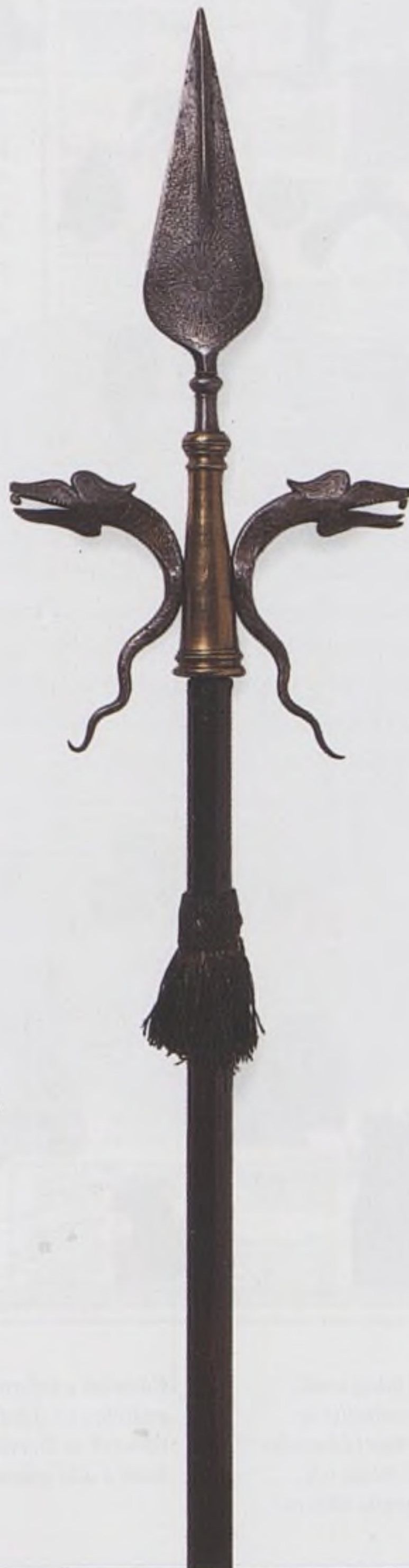
Francouzský doutnák z 18. st. – zápalník pro odpalování střelného prachu v dělech