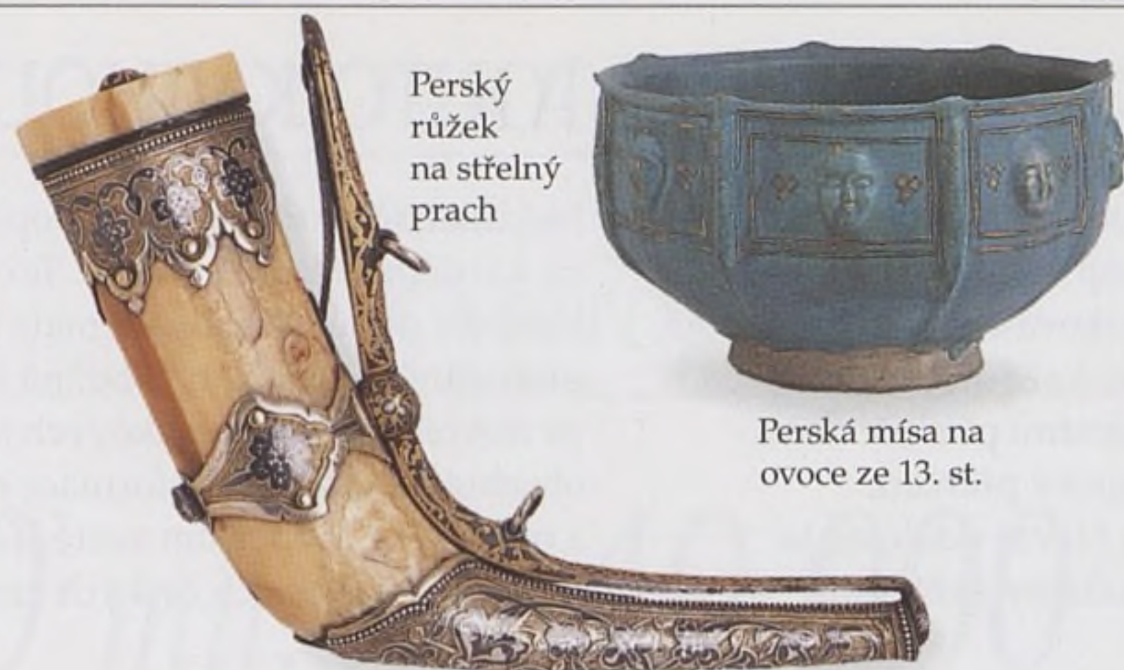
Perský růžek na střelný prach