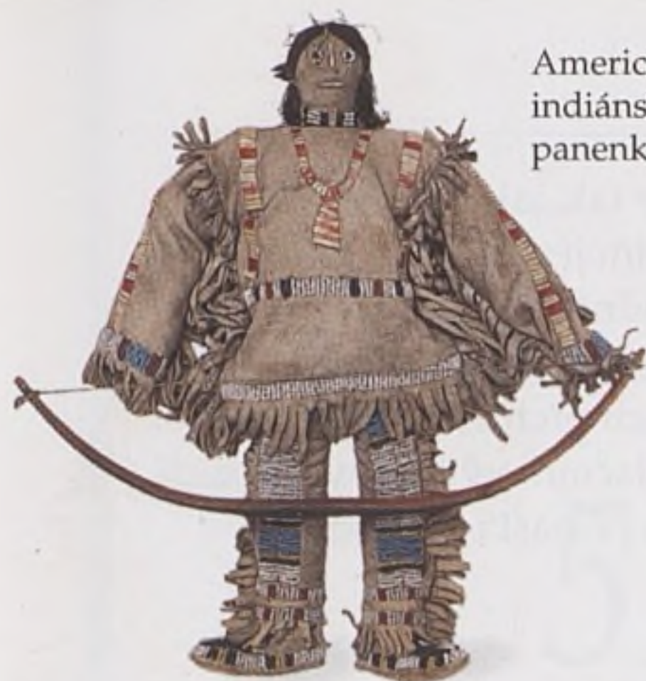
Americká indiánská panenka