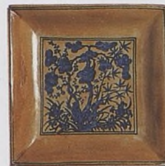
Čínský talíř z období dynastie Ming