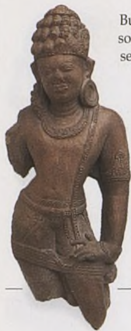
Buddhistická soška ze 7. st., severní Indie