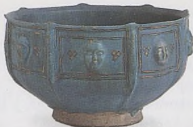
Perská mísa na ovoce ze 13. st.