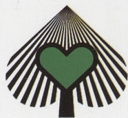
Ministerstvo životního prostředí ČR