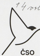
Česká společnost ornitologická