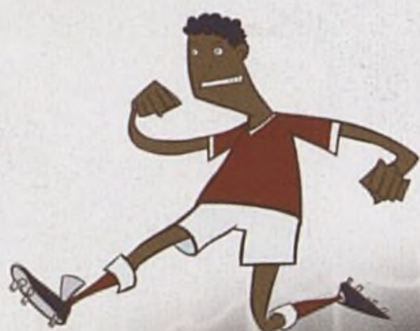
Gianluigi Buffon, Itálie