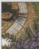
Pěšinka z dlažebních kostek a cihel 54