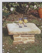
Stůl se soklem a kamennou deskou 58