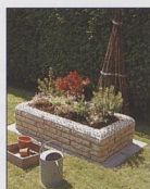
Ozdobný žlab 70