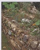
Kamenný obrubník zděný nasucho 46