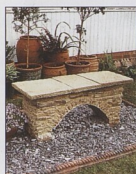
Lavička s obloukem 76