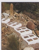
Stupně z bloků s výplněmi 66