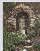
Výklenek s románským obloukem 88