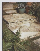
Schody dlážděné netříděným kamenem 82