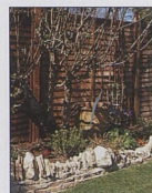
Zidka s balvány a krycí vrstvou 62