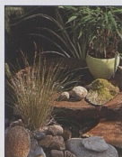
Japonský kámen suisseki 34