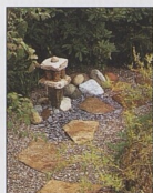
Japonská skalka 50