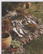
Tradiční skalka 26