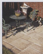
Staroanglická nepravidelná dlažba 38