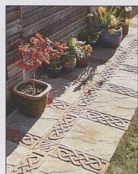
Cestička s magickými uzly 30