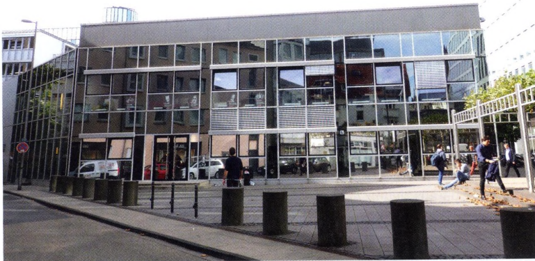
Das 1Live-Haus in Köln