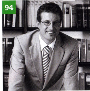
Änderungen im Projektverlauf

Titelbild Die selbsttätige Verschlussklappe der Trox GmbH verhindert bei abgeschaltetem Ventilator das Eindringen kalter und das Ausströmen warmer Luft; mit den Gewichten wird der Öffnungswiderstand justiert.