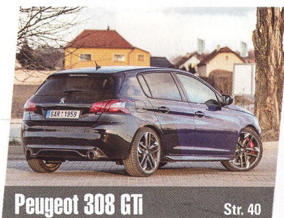
Peugeot 308 GTi