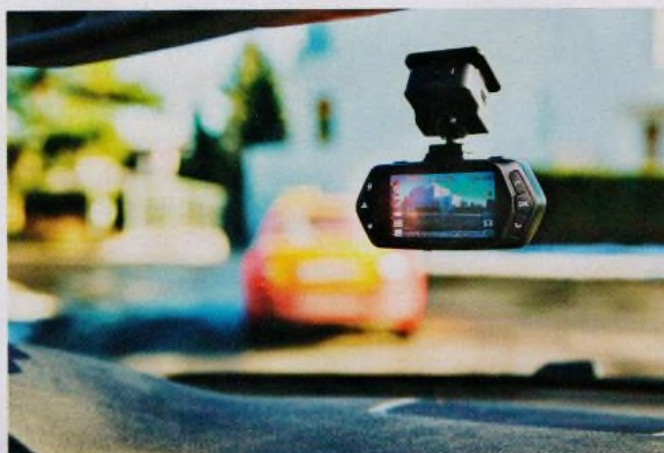
Aktuální modely kamer do auta (str. 20–23)