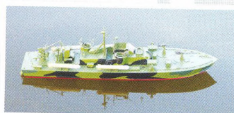
ELCO PT Boat 2. díl, Z. Bílek ..... 55

Staré pověsti modelářské aneb „sága staršího modeláře“ kapitola 6., J. Špinar ..... 52