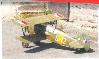
Avia B 534, A. Neugebauer ..... 3