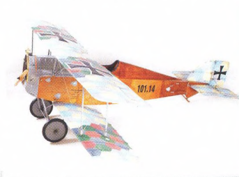
Aviatik Berg D1, A. Neugebauer ..... 30

Z mojí modelářské dílny – Výroba rozmetadla Z-37 Čmelák, Z. Kopeček ..... 29