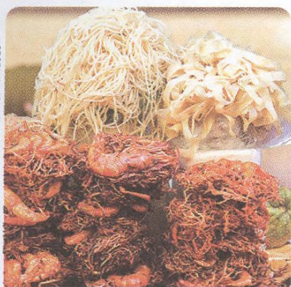
POULIČNÍ JÍDLO NA TRŽNICI BOGYOKA AUNG SANA STR. 54, YANGON