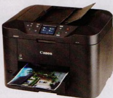
Test tiskáren pro domácí kancelář (str. 20–23)