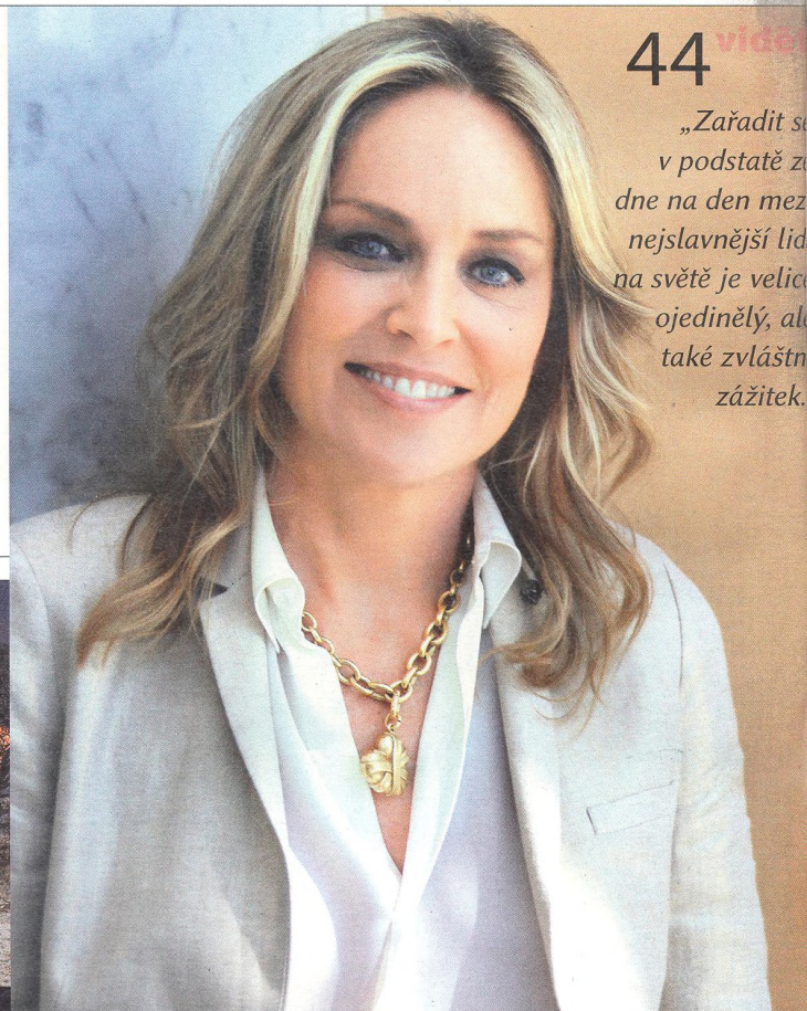
SHARON STONE herečka

„Mamka mi vyprávěla, jak si za války museli ve škole sami vyrobit ochrannou přilbu z rýžové slámy a nosit ji na hlavě.“