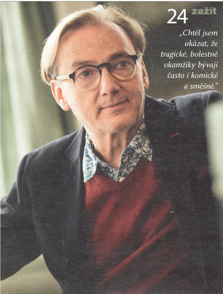
ONDŘEJ HAVELKA hudebník, režisér