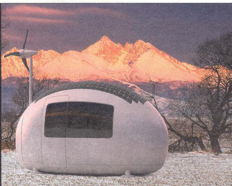
SOŇA POHLOVÁ & TOMÁŠ ŽÁČEK architekti

„Zachytili jsme zájem specializovaných týmů, které operují v oblasti katastrof a vyžadují určité hygienické standardy a energetickou soběstačnost.“