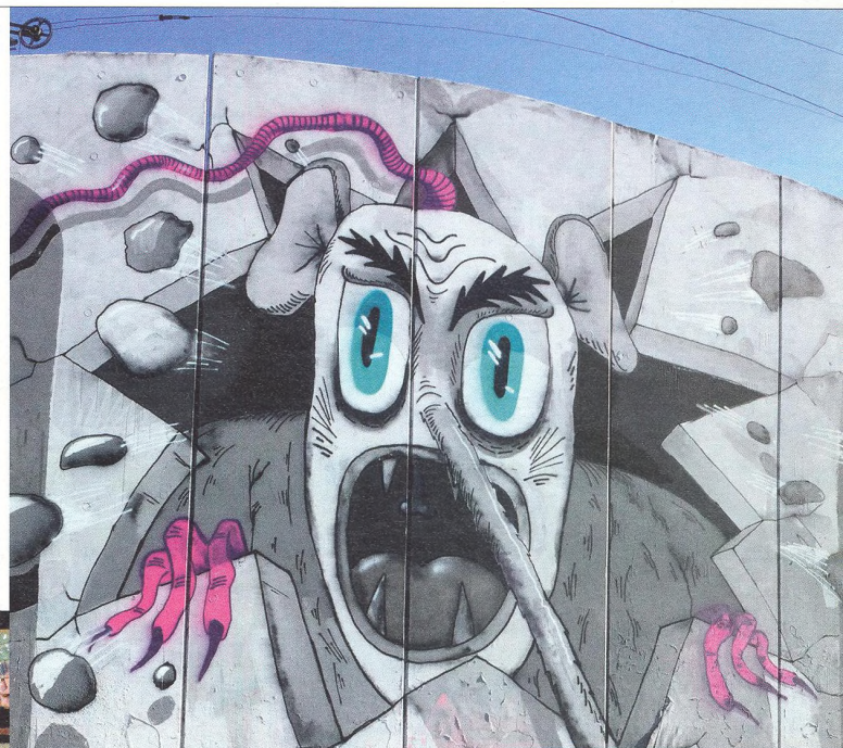
ONDŘEJ VYHNÁNEK výtvarník