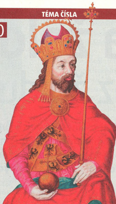
❖ Římský císař a český král Karel IV. na renesanční ilustraci