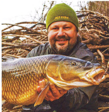
12 Expedice comizo / výprava za iberskou parmou