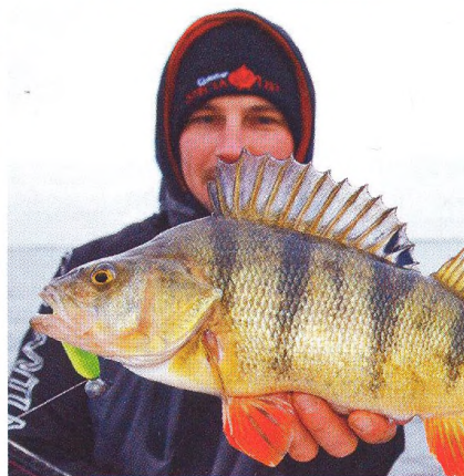
34 Velcí okouni a čtvero ročních období