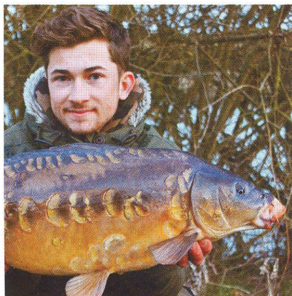
16 7 jarních tipů