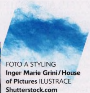
FOTO A STYLING Inger Marie Grini/House of Pictures ILLUSTRACE Shutterstock.com